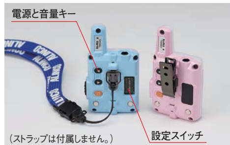
(ストラップは付属しません。)