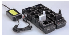
EDC-208R × 2 + EDC-162