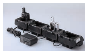
EDC-207A + EDC-207R × 3