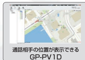
通話相手の位置が表示できる GP-PV1D