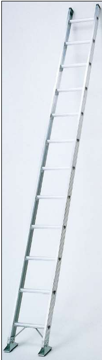
自動ロック装置付き