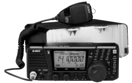
フロントパネル・セパレーションには別売のEDS-17が必要です。